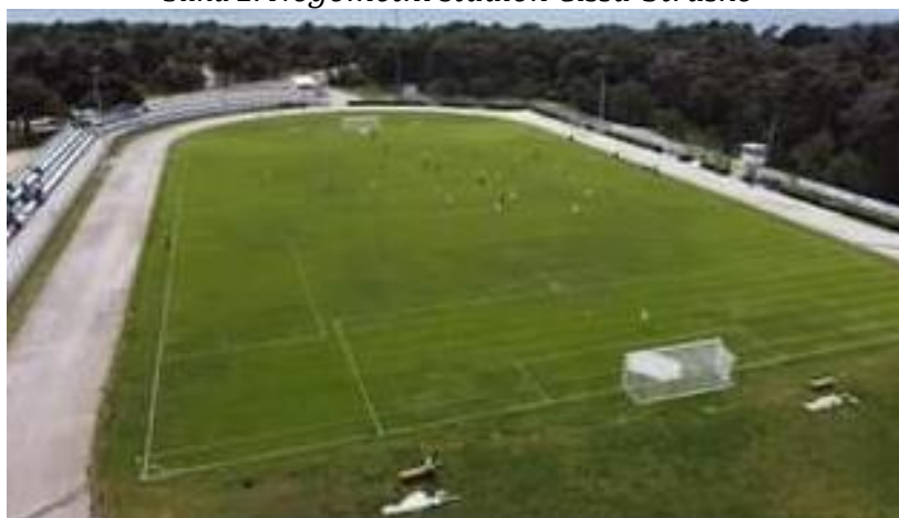
Slika 2. Nogometni stadion Cissa-Straško

Grad Novalja popisao je nogometni stadion Cissa-Straško, te je isti upisan i u Evidenciju imovine.