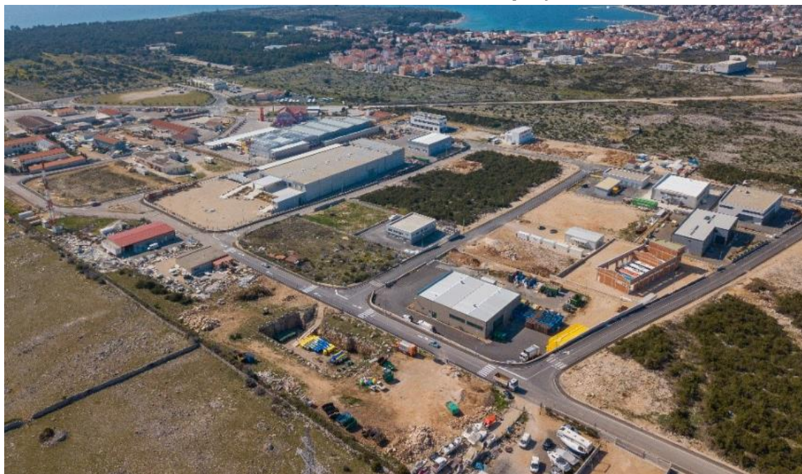
Slika 1. Poduzetnička zona Čiponjac

Poduzetnička zona Čiponjac opremljena je svom potrebnom infrastrukturom i u njoj djeluje više poduzetnika. Grad i dalje ulaže u razvoj poduzetničke zone kako bi investitori imali sve potrebno za poslovanje i kako bi se na području grada ali i šire zaposlilo što više osoba.